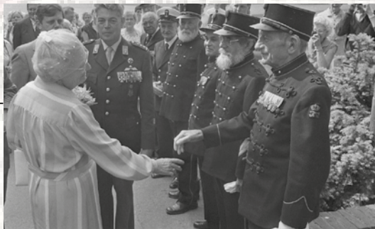
Prinses Juliana bezoekt Bronbeek, 21 juni 1984.

Prins Hendrik, de echtgenoot van koningin Wilhelmina, was erevoorzitter van de Koninklijke Nederlandsche Jachtvereniging "Nimrod". Op 1 augustus 1903 kwam hij naar Arnhem om de jaarlijkse schietwedstrijd van de vereniging bij te wonen. De wedstrijd werd gehouden op de schietbaan bij het Lange Water, net voorbij Bronbeek gelegen aan de Velperweg. Hij was enigszins verlaat en kwam pas aan toen het programma al afgewerkt was. Maar geen nood, er werd een nieuwe wedstrijd kleiduvenschieten aangekondigd, waarbij "Z.K.H. met succes verscheidene schoten op het zwevend doel" loste.